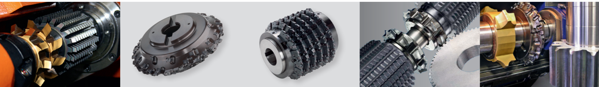
Verzahnungs- werkzeuge von LMT Fette